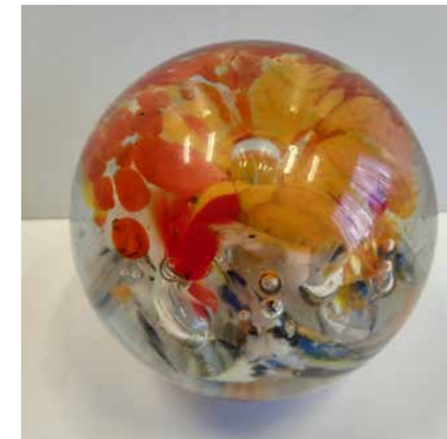
Glazen presse papier waarin oude autolampjes verwerkt zijn, particulier bruikleen