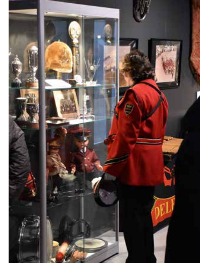
DHO-tentoonstelling in het MuzeeAquarium

In de herfstvakantie deed het museum mee met Oktobermaand Kindermaand, met een speciale activiteit: de Bodemschattendag, met als thema Mammoeten. Er werd een kleine expositie ingericht, mogelijk dankzij bruiklenen vanuit het Noordelijk Archeologisch Depot te Nuis en enkele mammoetfragmenten uit de eigen collectie van het museum. Die dag waren er twee lezingen