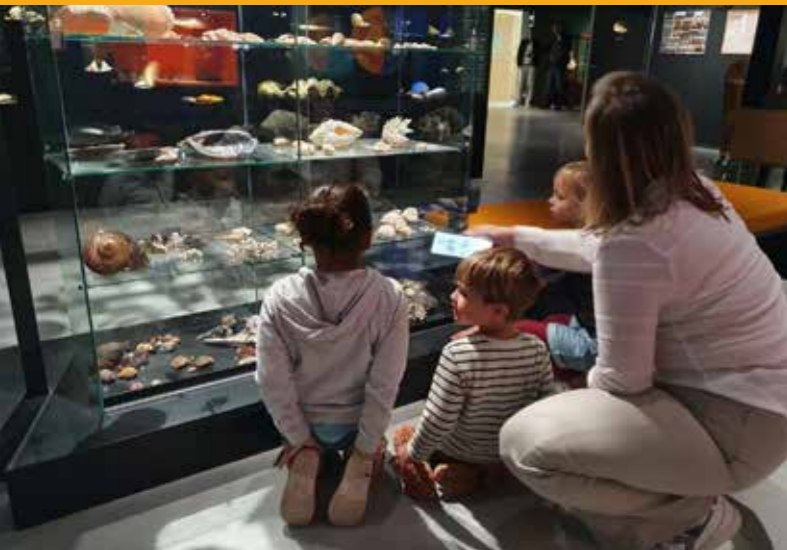
Bezoekers kijken naar de geologiecollectie