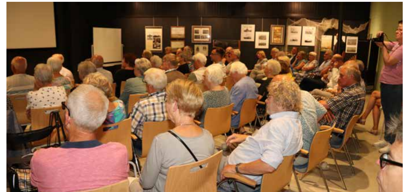
Opening van expositie Glas

Op het gebied van meerjaren sponsoring werd het moeilijker in 2022. Enkele grote bedrijven hadden al eerder aangegeven niet meer op basis van meerjarige contracten te willen werken, alleen op projectbasis. Nieuwe bedrijven in de regio zijn aangeschreven en daardoor kon Nobian als nieuwe sponsor worden verwelkomd. De bijdragen van sponsors worden ingezet voor eenmalige activiteiten en tijdelijke tentoonstellingen. De sponsors zijn terug te vinden op een groot bord bij de entree van het museum en hun logo's en namen staan op de affiches en uitnodigingen voor tentoonstellingen.