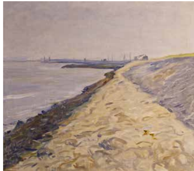
Schilderij 'Dijk bij Delfzijl', Jan ten Have, 1939

Donateurs ontvangen elk kalenderjaar een pasje dat recht geeft op gratis entree voor henzelf en een metgezel. Omdat de pasjes gescand worden bij de balie, is