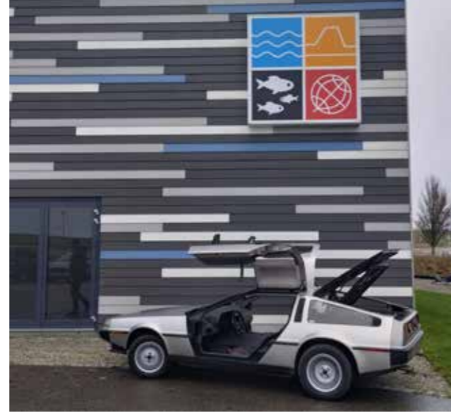
Delorean voor het museum

Alle activiteiten en tentoonstellingen hebben als doel om de collectie van het MuzeeAquarium in de spotlights te zetten en te verbinden met de actualiteit. Door veel aandacht aan de activiteiten te besteden via persberichten en posts op social media, wordt een steeds breder publiek naar het aquarium getrokken.