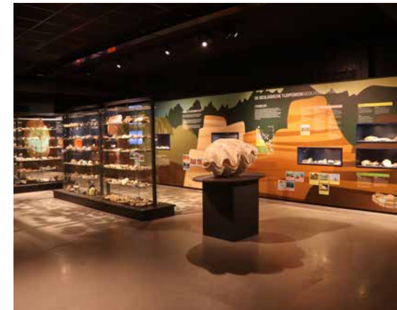
Geologiewand en doopvontschelp

Ook in 2022 is de collectie uitgebreid met een aantal aankopen en schenkingen. De belangrijkste aankopen zijn de eerder genoemde schilderijen, de in totaal 21 schenkingen betreffen scheepsmodellen, scheepsbenodigdheden zoals instrumenten om route en snelheid te bepalen, en een bijzondere porseleinen beker. Deze beker werd via de mail aangeboden, door iemand uit het zuiden van ons land die de beker gevonden had in de plaatselijke kringloopwinkel. Aan de ene kant van de beker staat 'J.R. van Dam, banketbakkerij en hofleverancier Delfzijl'. Aan de andere kant een tekening van de bakkerij met daaronder de tekst: 'Groeten uit Delfzijl'.