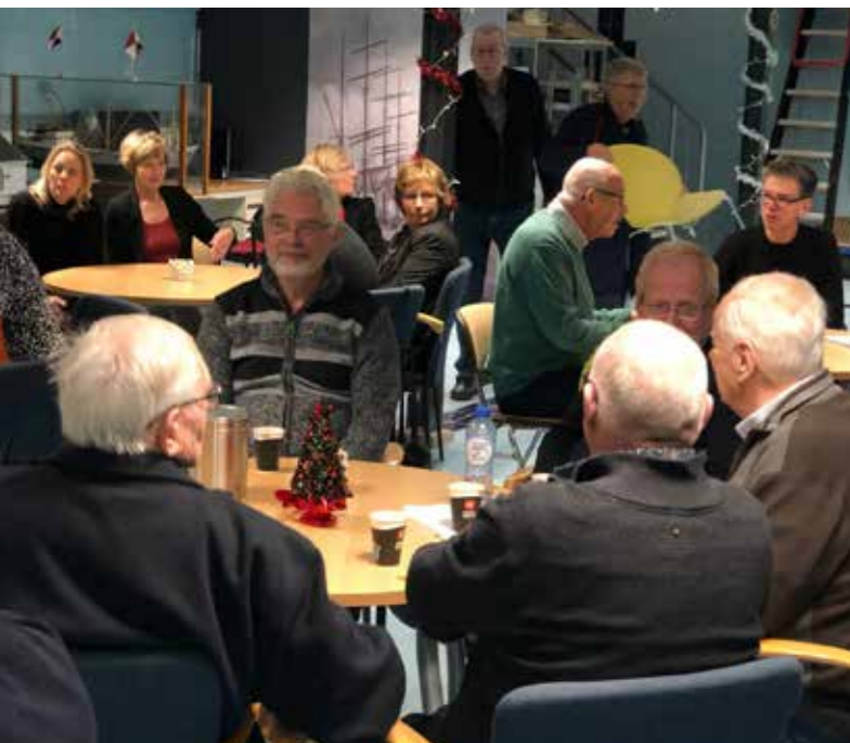
Kerstborrel in het souterrain

Het bestuur van het MuzeeAquarium heeft zich geconformeerd aan de Code Cultural Governance en hanteert een bestuursreglement en directiereglement. Het bestuur vergadert normaalgesproken tien keer per jaar, zo ook in het afgelopen jaar. Naast de Code Cultural Governance is er ook oog voor diversiteit en inclusiviteit. Vanaf het einde van 2022 neemt het museum deel aan de door de provincie Groningen en gemeente Groningen opgezette workshop over de Code Fair Pay/Fair Practice, samen met het Hoogeland Museum Warffum en het Veenkoloniaal Museum te Veendam.