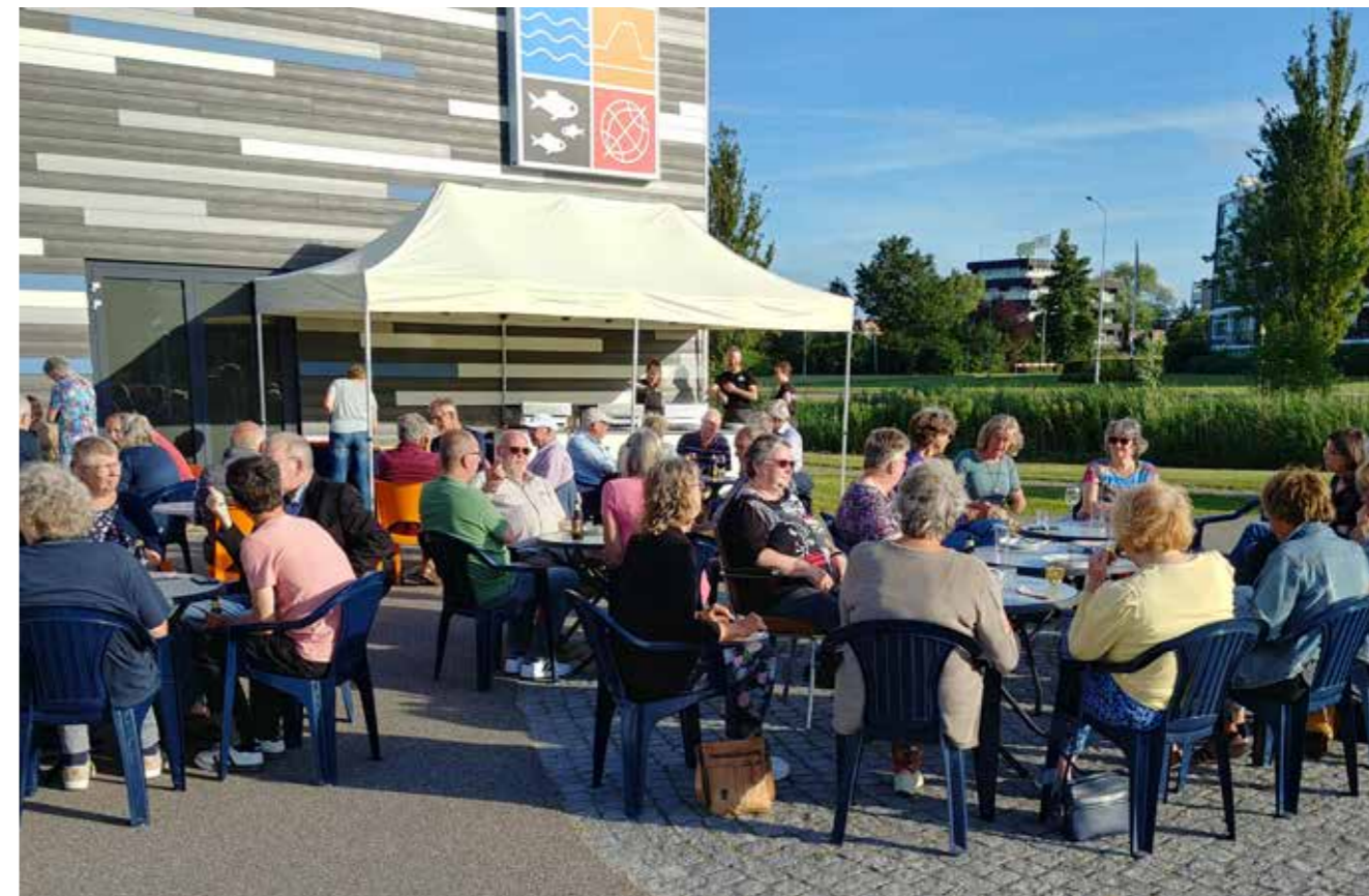
Barbecue op het plein voor het museum in juli

Het is een gezellige grote groep bij elkaar: 70 vrijwilligers plus 15 medewerkers van de VVV: in 2022 woonden zoveel mogelijk vrijwilligers de zomerbarbecue bij en later in het jaar de kerstborrel. De zomerbarbecue was ook om te vieren dat er geen beperkingen meer waren, en