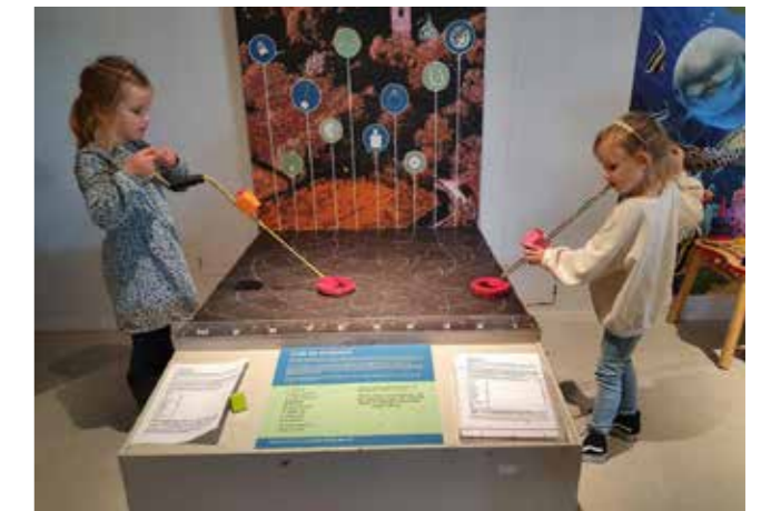
Het detectorspel is al jaren populair

Toch kon het museum ook dit jaar weer een aantal mensen verblijden met een gratis entreekaartje: groepen Oekraïense vluchtelingen die in Delfzijl en omgeving verbleven en groepen uit het asielzoekerscentrum. Het museum heeft dankzij een schenker die anoniem wenst te blijven sinds een paar jaar een bedrag dat besteed kan worden aan bijzondere groepen uit de samenleving.