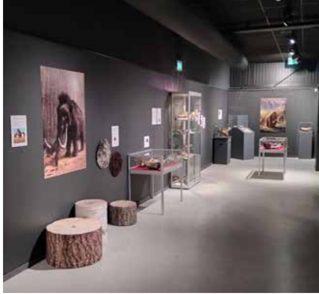
Bodemschattendag met als thema Mammoeten