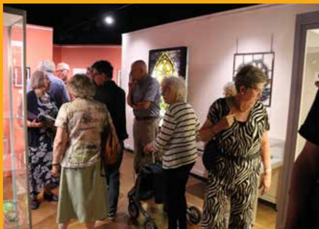
Bezoekers van de expositie 'Vormen van glas