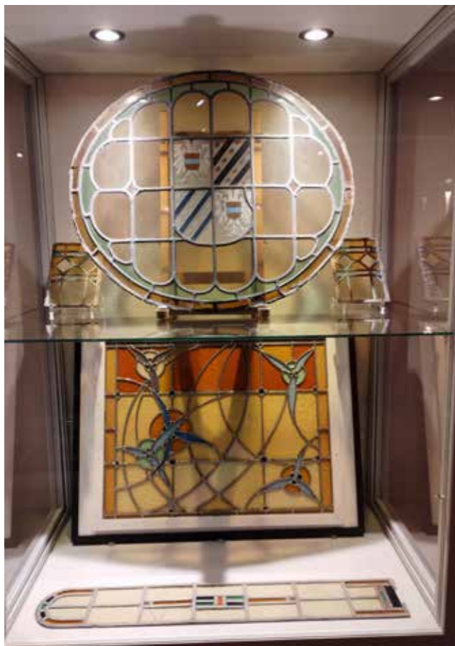
Glas in loodraam met het wapen van de Ommelanden, afkomstig uit het in 1995 gesloopte havenkantoor te Farmsum/Delfzijl.

voor de productie van glasvezel, maar ook bijzondere toepassingen, zoals de grill van een Scania-voertuig. De toepassing van glasvezel is bijzonder actueel omdat het bedrijf Delta Fiber bezig is met het aanleggen van een netwerk in de gemeente Eemdelta. Delta Fiber