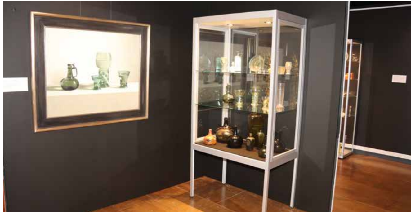
Vitrine met glas uit de collectie Helmantel

De daarop volgende wisseltentoonstelling had als thema 'Vormen van glas: sier- en gebruiksvoorwerpen van glas'. Voor deze tentoonstelling werd samengewerkt met diverse bruikleengevers. Het thema was zowel aan de collectie gelieerd als aan de omgeving van Delfzijl: sinds vele jaren is de sodafabriek een begrip in Delfzijl,