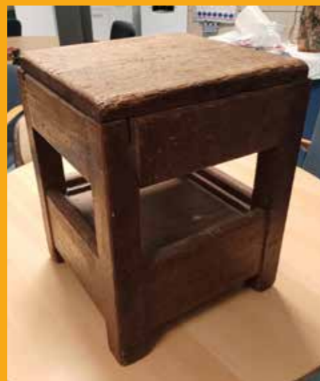
Recente schenking: krukje gebruikt tijdens touwsplitslessen op de zeevaartschool Abel Tasman te Delfzijl