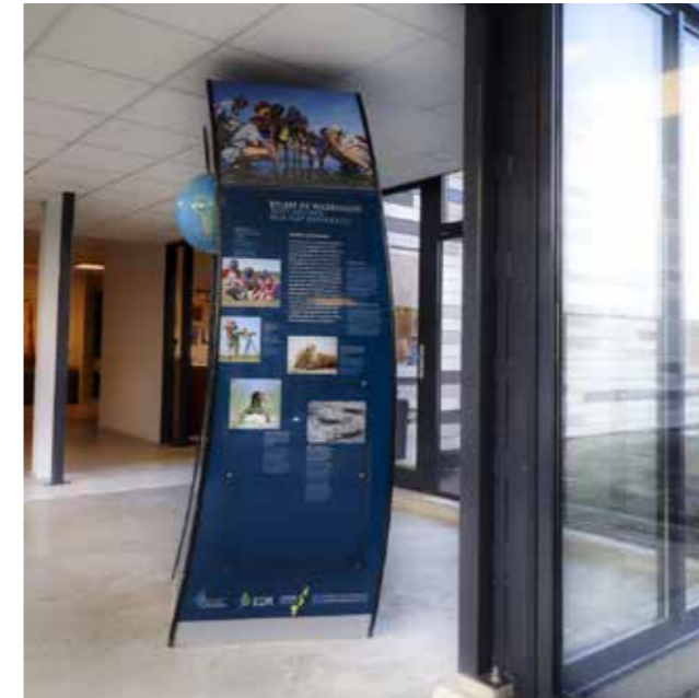
Zuil met informatie over werelderfgoed Waddenzee

en schelpen. Een havenstad als Delfzijl, ontstaan uit een vesting, was in menige oorlog een strijdtoneel en leverde een rijk scala aan objecten en verhalen op die de scheepvaarthistorie en de historie van Delfzijl als plaats vertegenwoordigen. De bezoeker kan van dit royale aanbod genieten in een museum waarin de route hem vanaf het rariteitenkabinet voert naar het ontstaan van de aarde, mineralen, gesteenten, schelpen, fossielen, archeologie met het meest noordelijke hunebed van Nederland als topstuk en dan via een presentatie over het ontstaan van Delfzijl als plaats naar het thema scheepvaarthistorie.