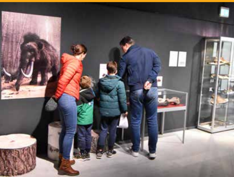
Bezoekers bekijken de mammoettentoonstelling op de Dag van de bodemschatten