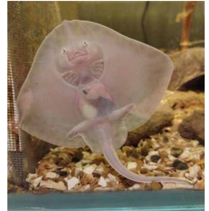
Babyrog van een paar weken oud