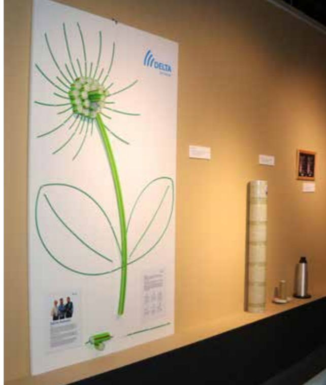
Paneel van Delta Fiber met informatie over glasvezeltoepassing

voor de productie van glasvezel, maar ook bijzondere toepassingen, zoals de grill van een Scania-voertuig. De toepassing van glasvezel is bijzonder actueel omdat het bedrijf Delta Fiber bezig is met het aanleggen van een netwerk in de gemeente Eemdelta. Delta Fiber