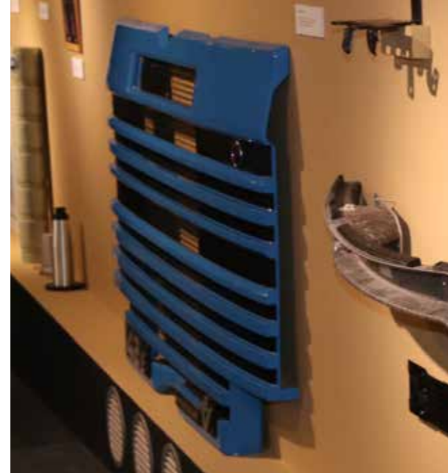
Scania-grill van NEG

In de kleinere expositieruimte werd een tentoonstelling ingericht over het Delfzijls Harmonie Orkest: zij vierden hun 135-jarig bestaan, wat vanwege corona een jaar later plaatsvond dan was gepland. Tijdens de opening trad DHO op in het MuzeeAquarium. Pronkstuk van de tentoonstelling was het vaandel: ooit gemaakt dankzij de inwoners van Delfzijl: DHO werd namelijk uitgenodigd