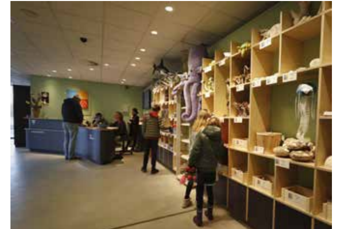
Bezoekers aan de balie in het museum

Voor elke afdeling zijn vrijwilligers te vinden, behalve voor de schoonmaak en de tuin. Deze werkzaamheden zijn daarom uitbesteed aan professionele bedrijven.