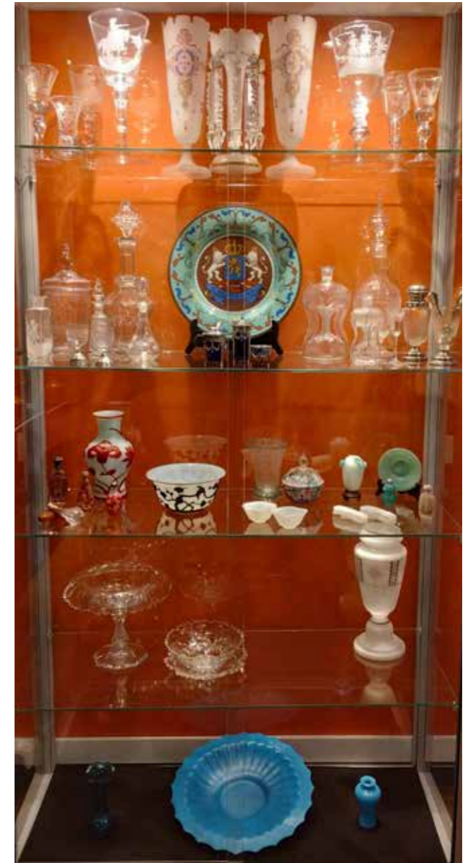
Vitrine met glas uit de collectie Jan Menze van Diepen

Voor informatie over de glasproductie en de toepassing van glasvezel werd samengewerkt met het internationale bedrijf NEG (Nippon Electric Glass) uit Westerbroek. Van hen leende het museum de grondstoffen