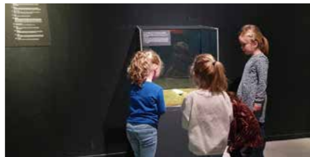
Schoolkinderen bezoeken het MuzeeAquarium

Voor wat betreft de interne communicatie houden de afzonderlijke collectiegroepen en de baliegroep overleg. Mededelingen gaan via een mailing en vier of vijf keer per jaar ontvangen de vrijwilligers van het museum en de VVV de interne nieuwsbrief.