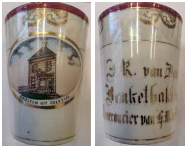
Voorzijde en achterzijde van de porseleinen souvenirbeker

Het aankoopbedrag viel in het niet bij de toch al geringe verzendkosten, maar voor de collectie Oud Delfzijl is het een kostbare aanwinst. Het museum vergoedde de kosten dan ook graag aan de oplettende aanbieder.