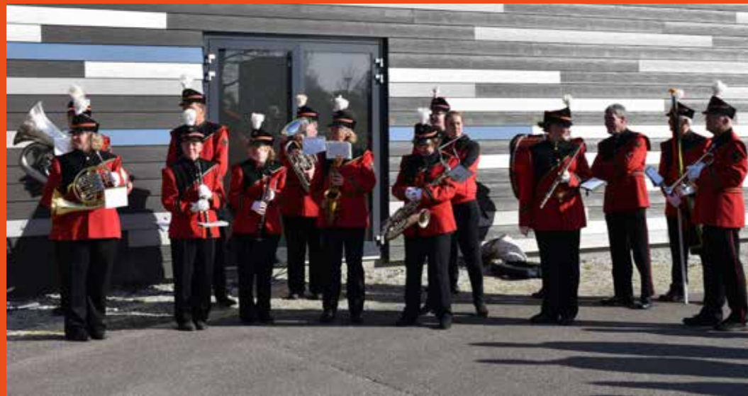
Optreden van DHO tijdens de opening van de tentoonstelling