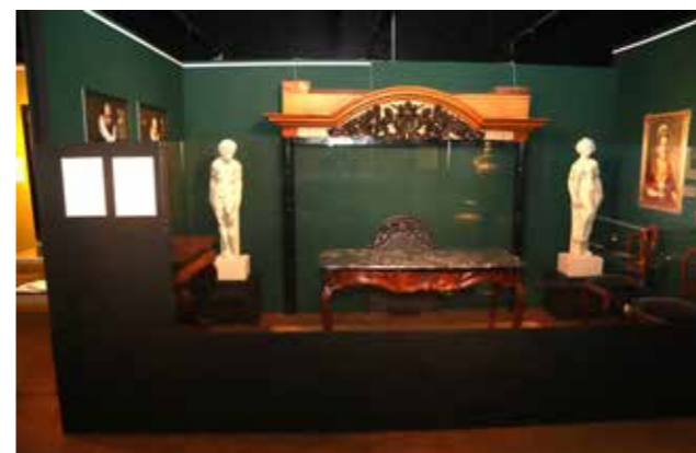
De stijkkamer op de tentoonstelling Borgen in Eemsdelta

Naast het Groninger Museum heeft ook het Fries Museum een bruikleen gegeven: een rouwbord met adellijke familiewapens. Verder waren er bruiklenen uit Museum Stad Appingedam, de kerk van Farmsum en ook particu-