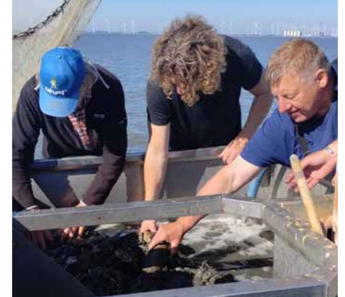
Met de vissersboot er op uit om garnalen te vangen voor het aquarium

Ook in 2023 is de collectie uitgebreid met een aantal aankopen en schenkingen. De belangrijkste aankopen