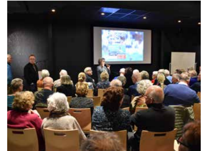
De opening van de expositie Beelden in beweging

In de eerste week van 2023 stond de tentoonstelling over glaskunst nog opgesteld in de wisselzaal. Deze maakte in februari plaats voor de tentoonstelling 'Beelden in beweging', met foto- en filmbeelden van historisch Delfzijl en bijzondere objecten, zoals een collectie fototoestellen en projectoren en een heel antiek fototoestel van de eerste bioschoopeigenaar van Delfzijl, dhr. Schepel. Als onderdeel van de expositie waren vier schermen opgesteld, waarop zowel bekende als niet eerder vertoonde films van Delfzijl te zien waren. Een bijzondere bijkomstigheid was, dat het museum enige tijd geleden een complete collectie glasdia's had ontvangen uit de nalatenschap van de Delfzijlster fotograaf P. Dijkstra, die vanaf het midden van de vorige eeuw veel schepen had gefotografeerd: een feest van herkenning voor de oudere generaties Delfzijlsters. Daarom wilde het museum zoveel mogelijk mensen de gelegenheid geven om de tentoonstelling te kunnen bekijken: de tentoonstelling werd verlengd tot en met de zomervakantie.