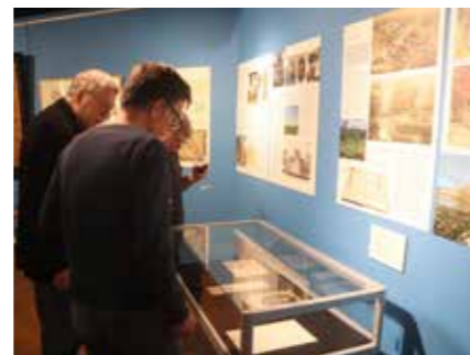
De opening van de tentoonstelling Borgen in Eemshaven.

noord-oost Groningen en waarop je (beeld)informatie kon vinden over alle borgen in de regio.