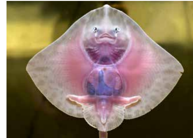
Een pasgeboren roggetje is bijna doorzichtig

In het rariteitenkabinet van het museum wordt de bijzondere combinatie van collecties toegelicht: de oorsprong ligt in het Museum voor Overzeese Handelsbetrekkingen dat al in 1929 werd opgericht in Delfzijl. Dankzij de scheepvaart was de havenplaats een internationaal toneel voor handelsverkeer. Zo ontstond een collectie van artefacten uit verschillende landen en na-