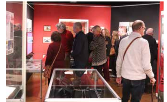
Een impressie van de expositie Beelden in beweging