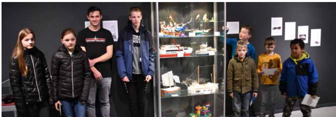
Prijswinnaars van de wedstrijd 'Bouw je eigen scheepsmodel'

Naast tentoonstellingen werden ook activiteiten georganiseerd: dat begon op de laatste dag van de kerstvakantie met de 'Dag van het scheepsmodel'. Hiervoor was een wedstrijd georganiseerd, waarbij kinderen hun