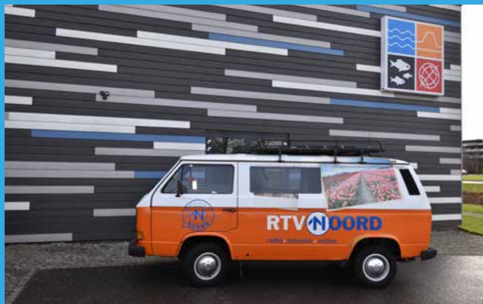
Het bekende busje van RTV Noord voor het MuzeeAquarium