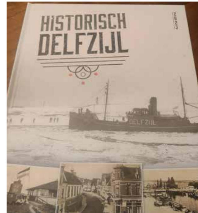
Het Jumboboek over Historisch Delfzijl

Een bijzondere activiteit was het Jumbo-boek: de Jumbo-vestiging aan de Jachtlaan in Delfzijl wilde graag een actie opzetten, waarbij klanten stickers konden sparen voor een verzamel-album over de historie van Delfzijl. Hiervoor werd medewerking gezocht met het MuzeeAquarium, om de afbeeldingen en teksten te verzamelen. Een aantal medewerkers heeft zich hiermee beziggehouden en het resultaat was bijna een rage: de boeken waren niet aan te slepen en de plaatjes werden overal geruild. Aan het eind van de actie werd samen met de Jumbo een ruildag georganiseerd in het MuzeeA-