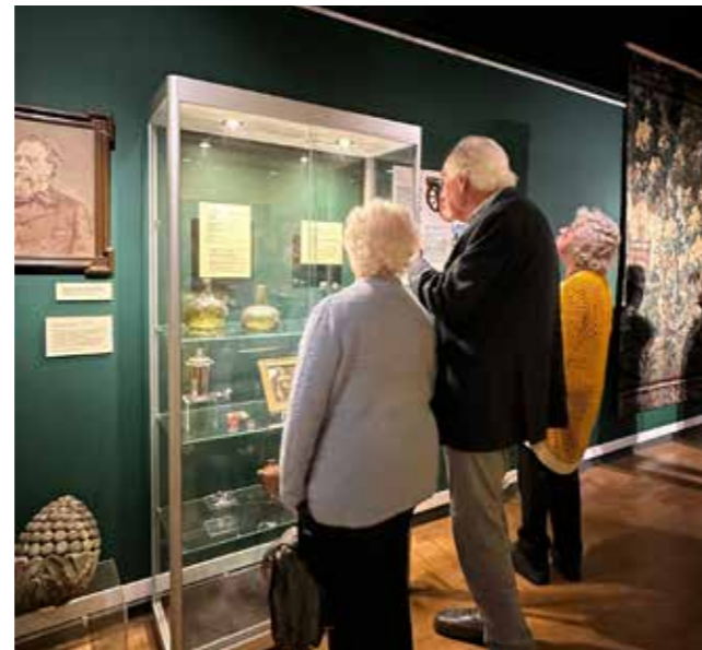
Bezoekers kijken naar een tentoonstelling