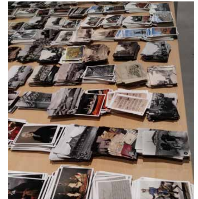
De voorbereidingen voor de jumboplaatjesruilmiddag

Een bijzondere activiteit was het Jumbo-boek: de Jumbo-vestiging aan de Jachtlaan in Delfzijl wilde graag een actie opzetten, waarbij klanten stickers konden sparen voor een verzamel-album over de historie van Delfzijl. Hiervoor werd medewerking gezocht met het MuzeeAquarium, om de afbeeldingen en teksten te verzamelen. Een aantal medewerkers heeft zich hiermee beziggehouden en het resultaat was bijna een rage: de boeken waren niet aan te slepen en de plaatjes werden overal geruild. Aan het eind van de actie werd samen met de Jumbo een ruildag georganiseerd in het MuzeeA-