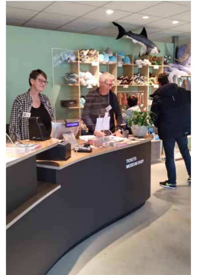
Baliemedewerkers in het museum

Voor elke afdeling zijn vrijwilligers te vinden, behalve voor de schoonmaak en de tuin. Deze werkzaamheden zijn daarom uitbesteed aan professionele bedrijven.