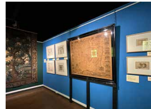
Impressie van de tentoonstelling Borgen in Eemsdelta

Naast het Groninger Museum heeft ook het Fries Museum een bruikleen gegeven: een rouwbord met adellijke familiewapens. Verder waren er bruiklenen uit Museum Stad Appingedam, de kerk van Farmsum en ook particu-