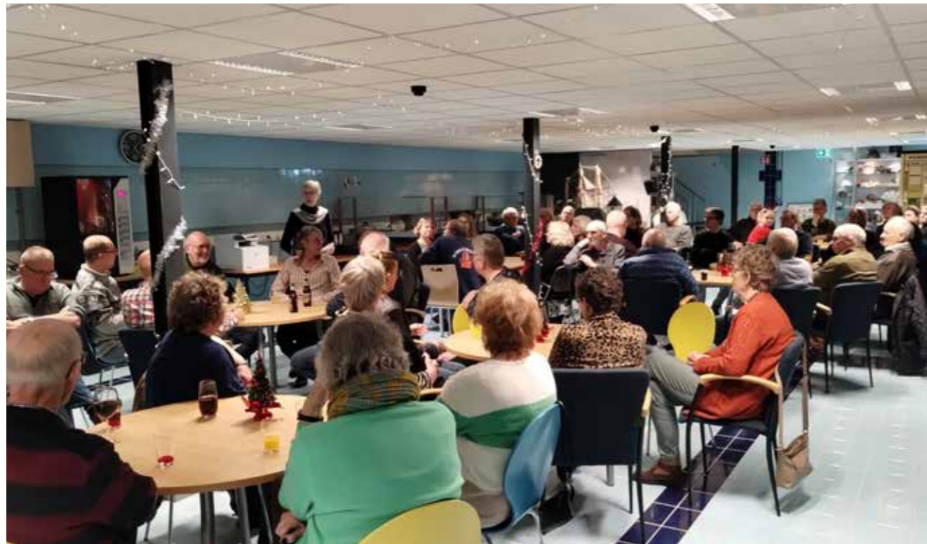
Vrijwilligers in het souterrain

een bestuursreglement en directiereglement. Vanaf het moment van introductie van deze code is een rooster van aftreden ingegaan. Het bestuur vergadert normaalgesproken tien keer per jaar, zo ook in het afgelopen jaar. Naast de Code Cultural Governance is er ook oog voor de Code diversiteit en inclusie. Vanaf het einde van 2022 neemt het museum deel aan de door de provincie Groningen en gemeente Groningen opgezette workshop over de Code Fair Pay/Fair Practice, samen