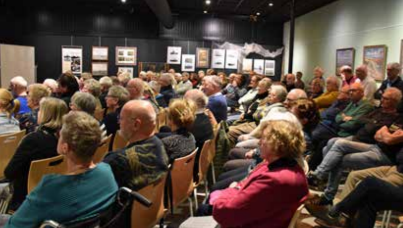
Drukbezochte opening