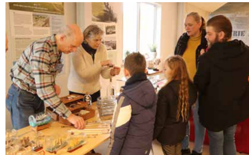
'Dag van het scheepsmodel'

Hoogtepunt van de dag was de onthulling van de 'Mathilde', een groot scheepsmodel dat helemaal door vrijwilligers was gerestaureerd. Het schip was geschonken door de voormalige zeevaartschool op Terschelling: het model dateerde van 1948 en werd gebruikt om les te geven over tuigage. De 'Mathilde' had oorspronkelijk gevaren onder de vlag van Delfzijl, een reder uit Delfzijl was de eigenaar in de 19e eeuw. Dat het model weer hele-