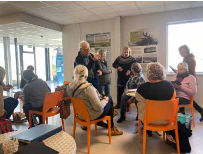
Bezoekers in het museum

Donateurs ontvangen elk kalenderjaar een pasje dat recht geeft op gratis entree voor henzelf en een metgezel. Omdat de pasjes gescand worden bij de balie, is voor het museum zichtbaar dat van deze mogelijkheid dankbaar gebruik wordt gemaakt. De donateurs worden uitgenodigd voor activiteiten en voor openingen van tentoonstellingen.