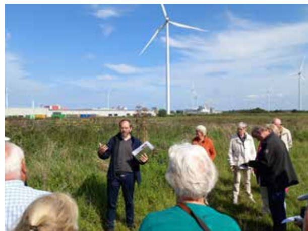
Onthulling van het informatiebord te Oosterwierum

Groninger Museum. Deze objecten heeft het MuzeeAquarium ook aangevraagd en in bruikleen gekregen. Voor het MuzeeAquarium was het een intensieve voorbereidingsperiode: er moest voor het eerst een faciliteitenrapport worden opgesteld, de verlichting moest gedimd kunnen worden omdat met name tekeningen en kaarten aan een minimale hoeveelheid licht blootgesteld mogen worden en sommige objecten vereisten een creatieve constructie om ze te kunnen exposeren, die door vrijwilligers werd bedacht: zoals voor het wandkleed en de schouw. Met deze tentoonstelling waren dan ook veel vrijwilligers intensief betrokken bij de opbouw, maar de 150 kilo wegende