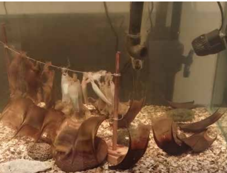
Haaien- en roggeneitjes

De collectie van het MuzeeAquarium is divers en bestaat uit een natuurhistorisch en cultuurhistorisch ge-