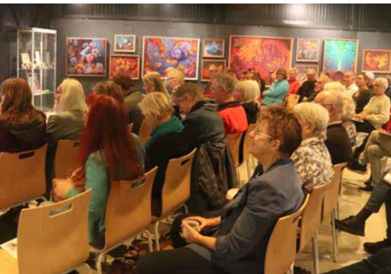
Bezoekers op de opening van de expositie Joep Hommerson