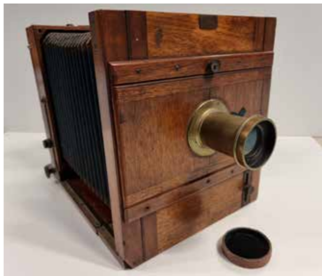
Het antieke fotoestel van dhr Schepel