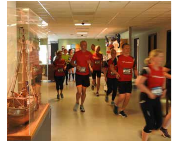
Pinkstertrailroute door het museum

Het MuzeeAquarium ontvangt reguliere subsidie van de gemeente Eemdelta, op basis van de exploitatiebegroting. De provincie Groningen geeft een vierjarige subsidie voor activiteiten, onder andere gebaseerd op het jaarlijkse activiteitenplan. Eén van de voorwaarden is, dat het museum zich niet alleen op een lokaal publiek richt, maar ook bovenregionaal opereert. Dat doet het museum door deel uit te maken van een bovenregionaal netwerk, maar ook door bijvoorbeeld bekendheid te geven aan haar aanbod in een gebied dat groter is dan de eigen provincie: Friesland, Drenthe en Noord-Duitsland. Bovendien zijn bijvoorbeeld de tentoonstellingen zo opgezet, dat ze ook aansprekend zijn voor bezoekers die Delfzijl (nog) niet kennen: thema's als fotografie en