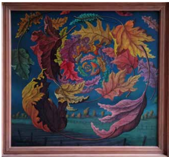
Schilderij van Joep Hommerson

De volgende tentoonstelling vond plaats in de Eemsaal: een overzicht van de schilderijen van Joep Hommerson, een schilder uit het dorp Bierum, dat in de buurt van Delfzijl ligt. Zijn werk is heel kleurrijk en fantasievol: het doet sterk denken aan de kunststromingen magisch realisme en fantastisch realisme: een soort droombeelden, realistisch geschilderd maar ontsproten aan de fantasie. De schilderijen kenmerken zich door de vele details en de bezoekers reageerden vooral verrast: ze verwachtten deze tentoonstelling niet in het MuzeeAquarium, zeker de mensen niet die wisten dat Hommerson zelden exposeert.