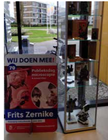
Deelname aan de microscopendag