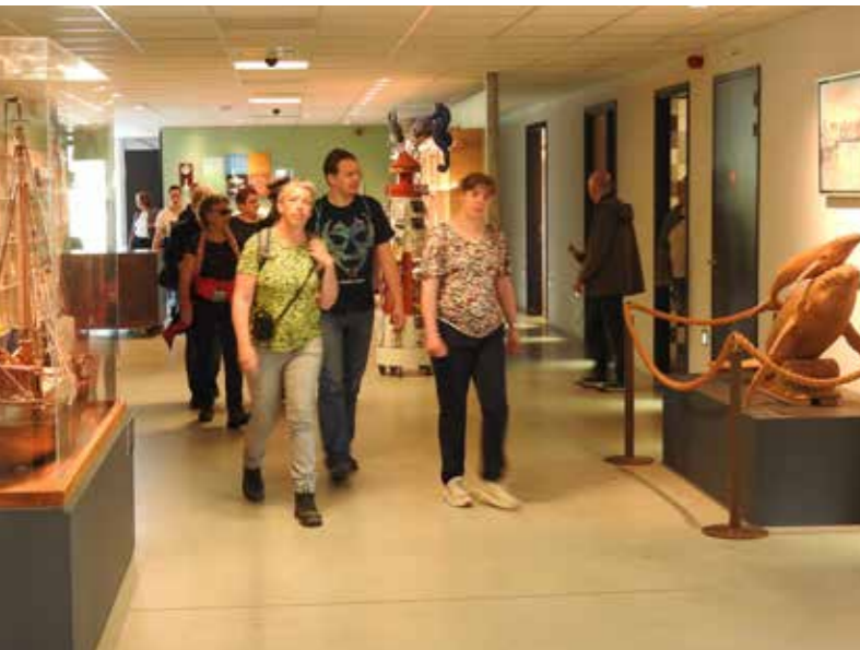
Bezoekers in het museum

We kunnen met een positief gevoel terugkijken op 2023: het aantal bezoekers passeerde voor het eerst sinds 2019 weer de grens van de 20.000, het aantal groepsarrangementen nam weer toe en met name in de schoolvakanties werd het museum druk bezocht. Een paar hoogtepunten waren de Dino-dag in de herfstvakantie met bijna 1000 bezoekers en de tentoonstelling 'Borgen in Eemsdelta' waar veel bezoekers speciaal voor kwamen. We merken dat de wisseltentoonstellingen een belangrijk onderdeel