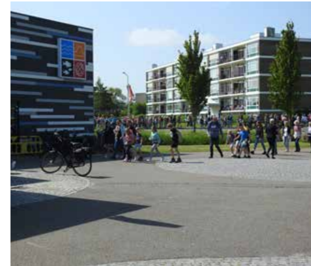
Pinkstertrailroute door het museum