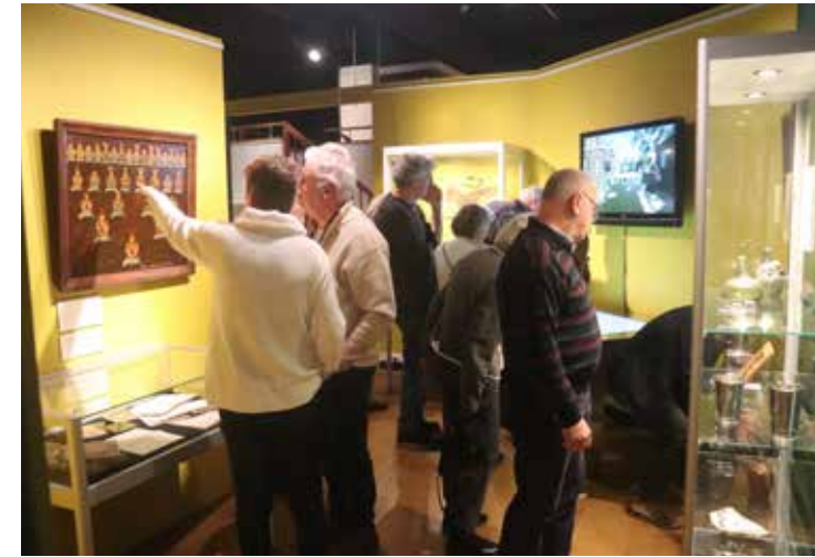
Bezoekers bij de wisseltentoonstelling 'Borgen in Eemsdelta'.

Voor de komende jaren betekent dat onder meer een uitbreiding van de geologie-afdeling met de thema's mammoeten, de bodem, en een actief gedeelte met microscopen en schermen. Voor de afdeling scheep-