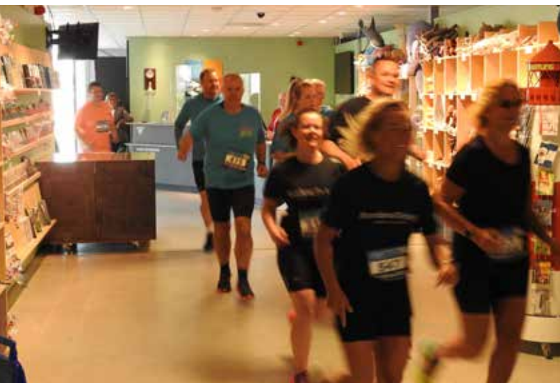
Deelnemers aan de cityrun lopen door de museumwinkel.

Het aanbod van het MuzeeAquarium is divers. Het bestaat uit een vaste presentatie over de historie van de plaats Delfzijl en omgeving, de haven, handel en de scheepvaarthistorie; archeologie en prehistorie, geologie, schelpen en een zeeaquarium. Topstukken zijn onder andere de bunker, het hunebed, de interactieve scheepvaartvitrine, de radiohut waar je zelf aan de knoppen mag zitten, de spectaculaire schelpenvitrine met lichteffecten, de 'pepper's ghost' van de zeilmaker, het baggersimulatorspel, het rariteitenkabinet en de ladenkast met gesteenten en de multimediale maquette van Delfzijl. In het aquarium is de kraamkamer met eieren van roggen en haaien en met babyvissen een echte publiekstrekker.