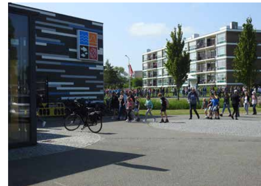
Een wedstrijdloop door Delfzijl leidt door het MuzeeAquarium.

Het MuzeeAquarium ontvangt subsidie van de gemeente Eemdelta en de provincie Groningen en wil dit ook de komende jaren graag bestendigen. Daarom presenteert het MuzeeAquarium hierbij haar meerjarenbeleidsplan, voor de periode 2025 tot en met 2028.