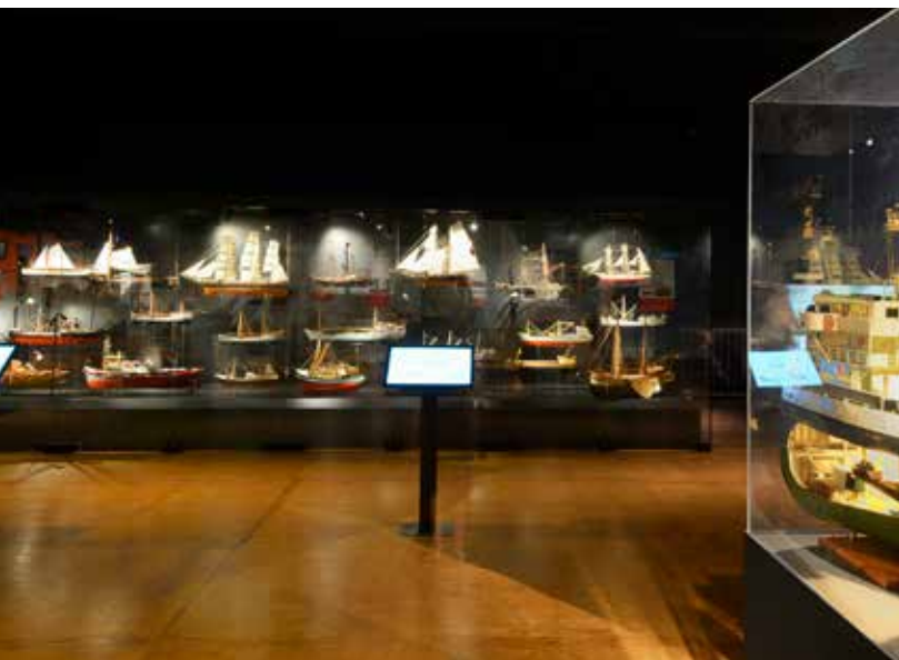
De interactieve scheepvaartvitrine met touch screens.

In tegenstelling tot veel musea is het overgrote deel van de collectie op zaal te zien en niet opgeborgen in het depot. Het depot is inpandig, ondergebracht in het souterrain. De collectie is voor een deel gedigitaliseerd en voor een deel digitaal geregistreerd. Deze registratie moet de komende jaren worden vernieuwd en uitgebreid met objectfoto's. Dit is de taak van een groep vrijwilligers, die werkt met een nieuw systeem, genaamd Atlantis.