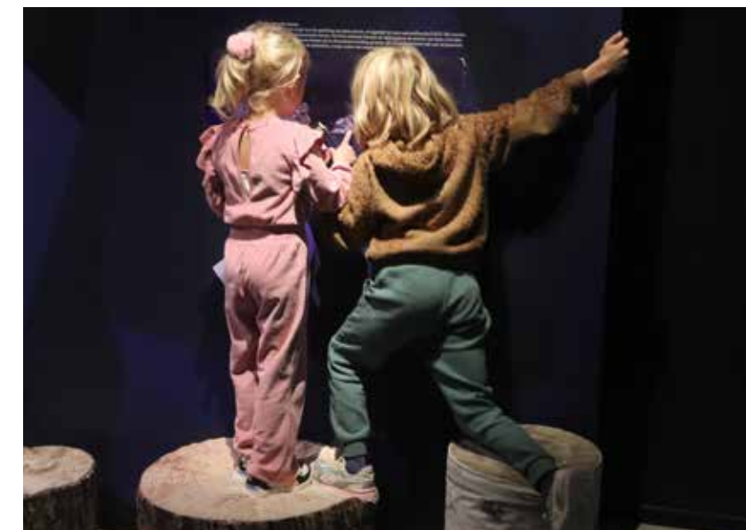
Als je op een knopje drukt, lichten de fluorescerende stenen op!