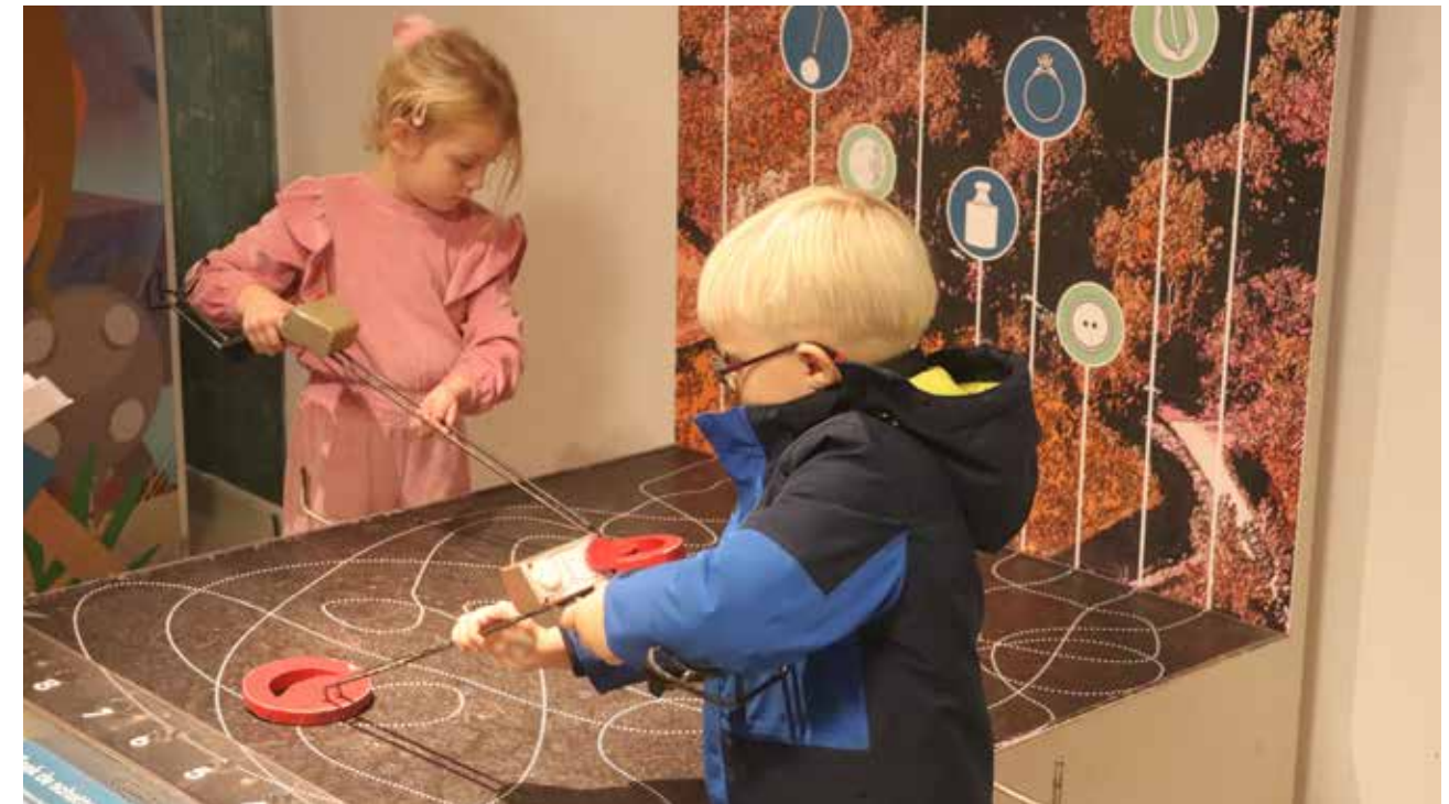
Het detectorspel is populair en geschikt voor kinderen vanaf 4 jaar.